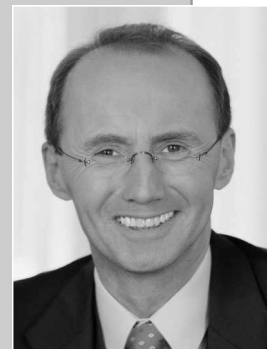
Mag. Othmar Karas, Mitglied des Europäischen Parlaments

jeder wohl fühlt, entwickeln! Im Besonderen gilt das für das Thema Europa. De facto ist Europapolitik schon längst Innenpolitik. Leisten wir gemeinsam einen Beitrag dazu, dass sie das auch in einem offenen und ehrlichen politischen Diskurs, in den Medien und vor allem in den Herzen der Menschen wird! Der Clu schreitet hier schon voran.