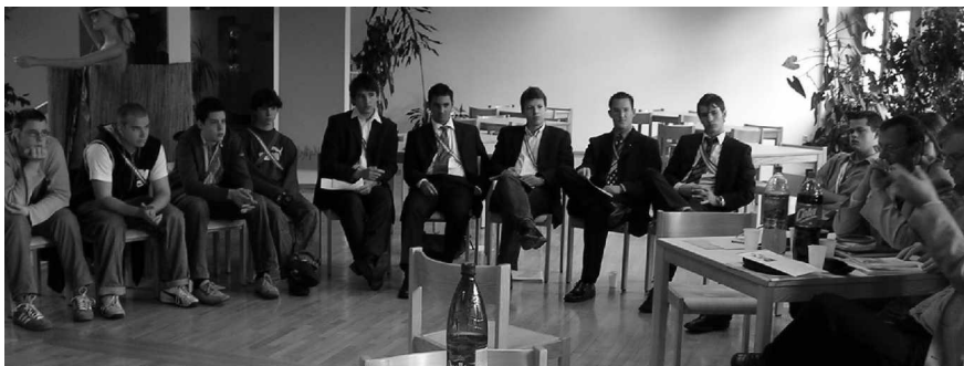
Beim Landesverbandsseminar „Verbindung und Politik“ wurde fleißig nachgedacht und diskutiert.

Ergebnis der Debatten: Couleurstudenten sollen politisch interessiert und aktiv sein. Verbindungen können und sollen sich als „politisch“ verstehen; das dürfe aber nicht ihre Unabhängigkeit und Meinungsvielfalt gefährden. Interessantes Detail für den MKV: Sein Grundsatzprogramm aus dem Jahr 1987, das im zweiten Teil des Seminars einer „kritischen Durchsicht“ unterzogen wurde, scheint recht „zeitlos“ zu sein. Jedenfalls fanden die Aktiven kaum Passagen, wo sie gravierenden Änderungsbedarf feststellten. ■