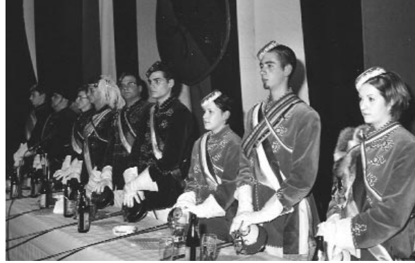
Chargierten-corps (rechts Clunia)