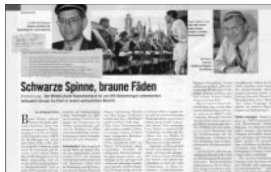
„profil“ Nr. 23 vom 3. Juni 2002