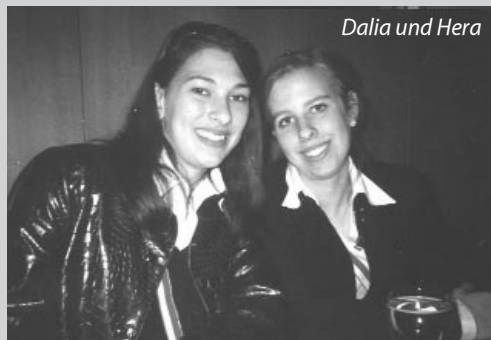
Dalia und Hera

le Menschen kennen zu lernen und eine wunderbare Zeit zu verbringen, was ja durch mein anschließendes Studium an der PädAk in Feldkirch bestens möglich sein wird.